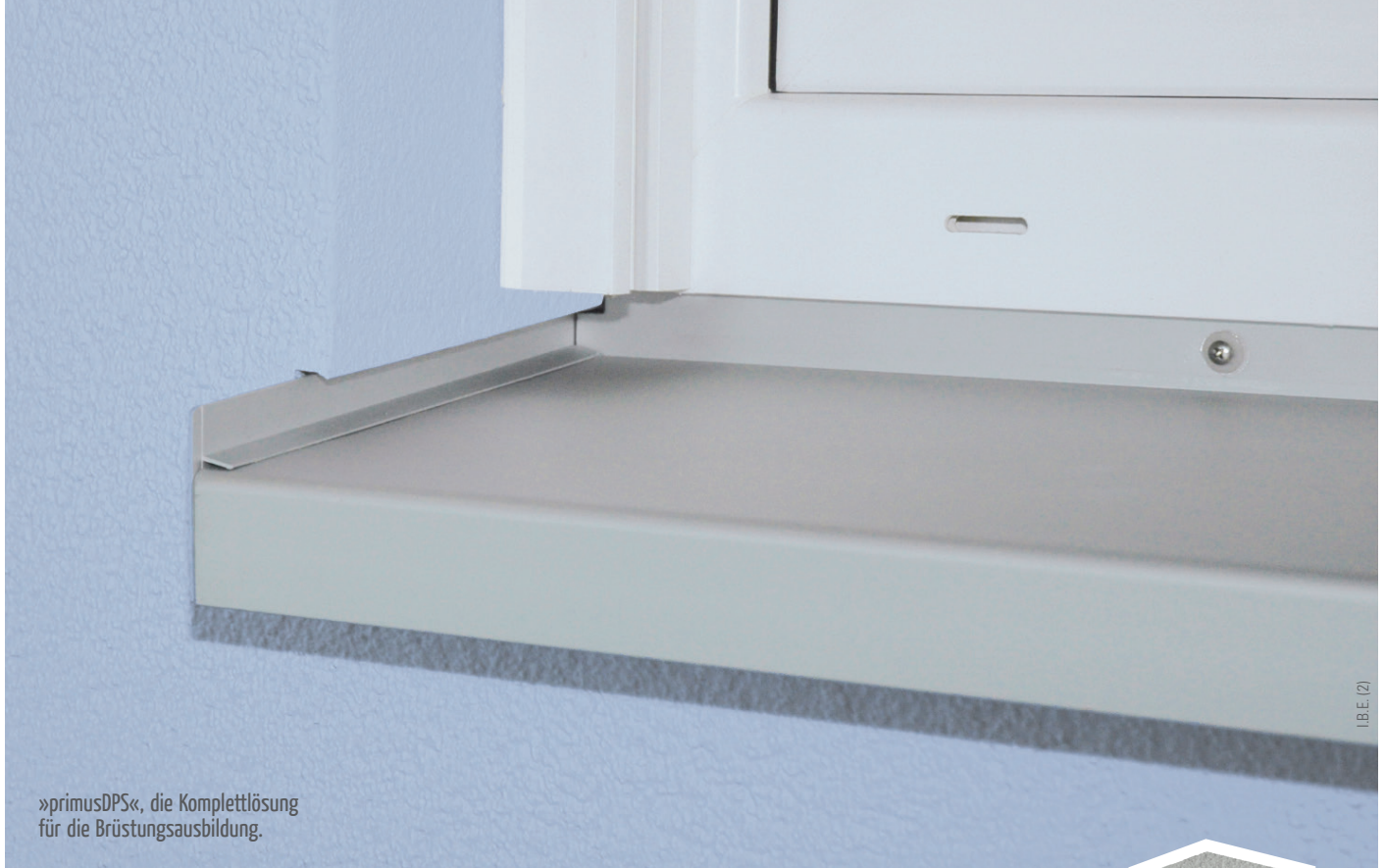
»primusDPS«, die Komplettlösung für die Brüstungsbildung.